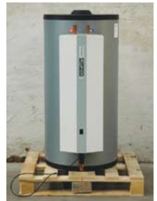
2. Aquinox OLB. Debiet van afgebeeld model: 1.230/10 min à 40°C