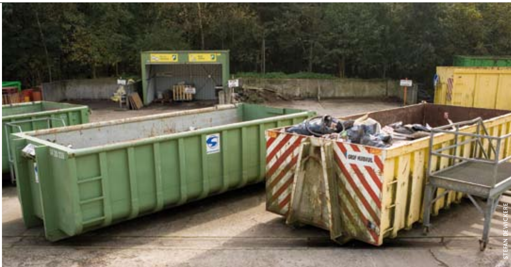
Moet een gemeente als ze containers van het containerpark van de hand doet, hiervoor btw aanrekenen aan de koper? Deze en andere veelgestelde vragen komen op de website van Financiën.