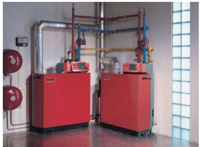
3. Remeha Gas 210 ECO. Vermogen van afgebeelde opstelling: 400 kW