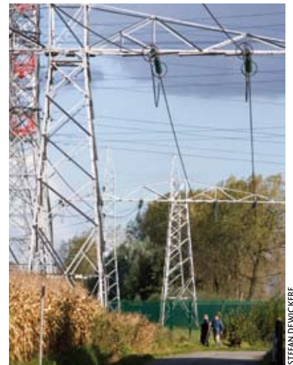
Op 13 februari ontvingen de gemeenten wellicht de laatste schijf van de Eliaheffing.

schoten geld uiteindelijk niet zouden terugkrijgen. Wanneer ze er ook niet in slagen om dit op te nemen in de nettarieven als noodzakelijke kosten, rest alleen een daling van hun winst. Daarvan zijn de aandeelhouders, de gemeenten dus, het slachtoffer. In het slechtste geval bestaat dus de kans dat de gemeenten een deel van de Eliaheffing die ze ontvingen via (nog) lagere dividenden weer zien verdwijnen.