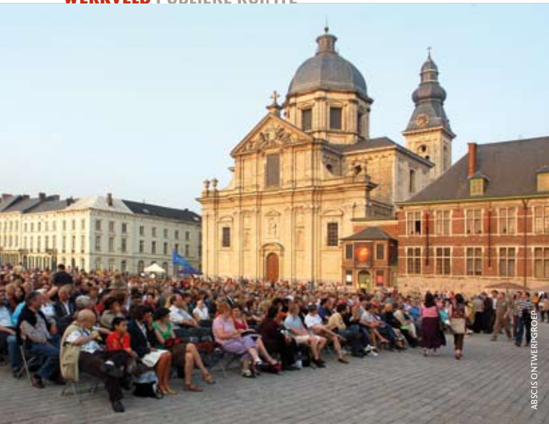
ABSCIS ONTWERP GROEP